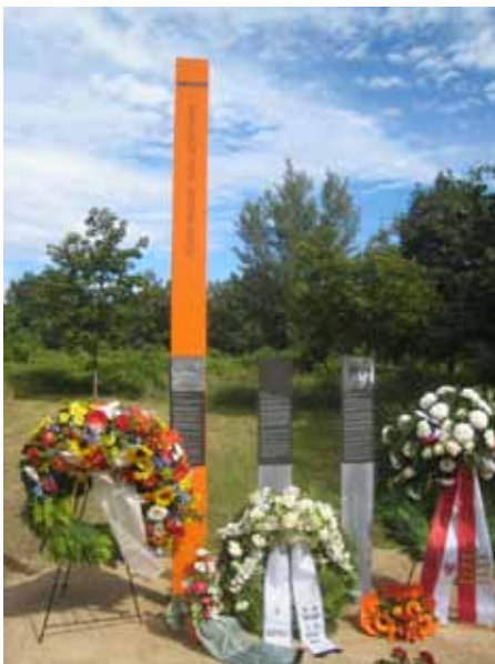
Übergabe der Stelen in Teltow