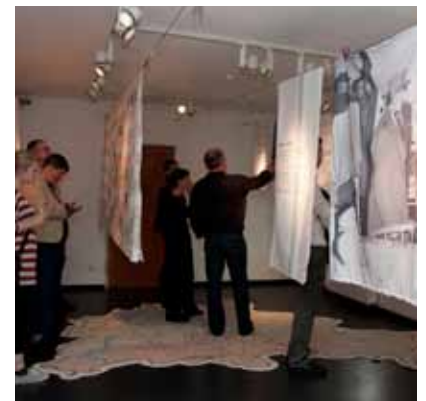
Sonderausstellung „Verschwunden und Vergessen. Flüchtlingslager in West-Berlin“

Die Sonderausstellung ist bis zum 30.12.2011 in der Erinnerungsstätte Notaufnahmelager Marienfelde zu sehen.