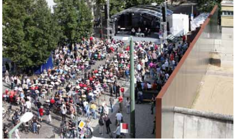
Mehr als 30.000 Besucher waren am 13. August 2011 in der Gedenkstätte Berliner Mauer