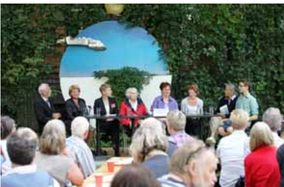
Beeindruckende Erzählungen im Zeitzeugencafe