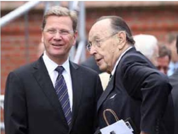
Außenminister Guido Westerwelle mit dem ehemaligen Außenminister Hans-Dietrich Genscher