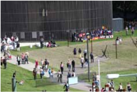
Kapelle der Versöhnung am 13. August 2011

So sehr auch der historische Ort in der Bernauer Straße durch Relikte der Mauer seine Authentizität erhält, geht Gedenken über Bewahren von Spuren hinaus. In unserer jüdisch-christlichen Tradition ist für das Erinnern eines Menschen entscheidend, dass sein Name immer wieder aufs Neue von nachfolgenden Generationen ausgesprochen und seine persönliche Geschichte erzählt wird. Das ist der Kern der Mauertotenandacht.