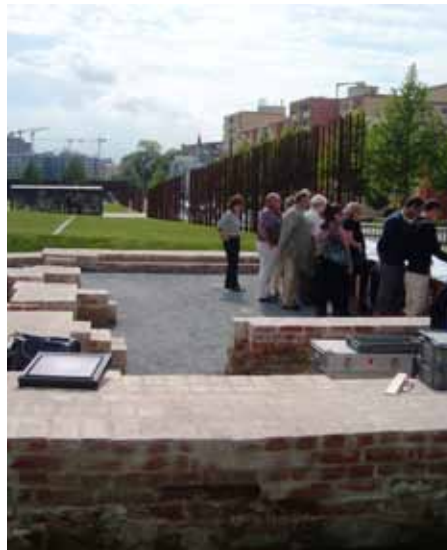
Sondage von zerstörten Grenzhäusern in der Bernauer Straße