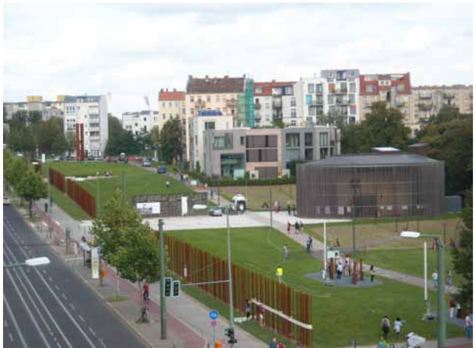
Ausstellungsbereich entlang der Bernauer Straße Ecke Ackerstraße