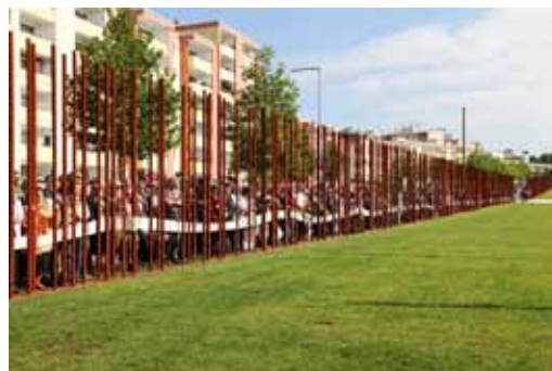
Die Gedenkveranstaltung und die Erinnerung an den Tag des Mauerbaus bewegte viele Menschen