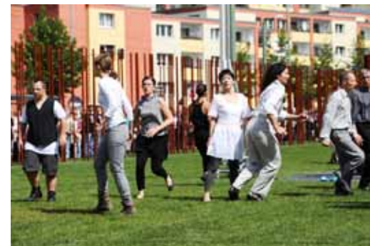
Tanzperformance „Between the Bricks“ auf dem neuen Teil der Außenausstellung, der am 13. August eröffnet wurde