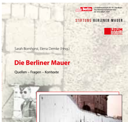
Sarah Bornhorst / Elena Demke (Hrsg.), Die Berliner Mauer. Quellen, Fragen, Kontexte (Werkstatt DDR-Geschichte für die Schule 4), Berlin 2011.