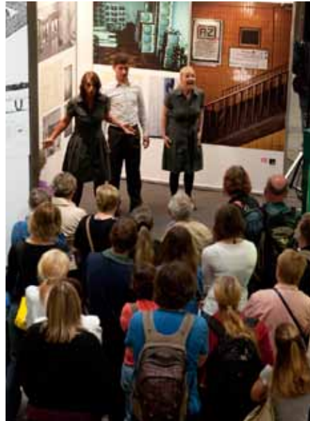
Theaterszenen „Mit der S-Bahn in den Westen“ im Bahnhof Friedrichstraße

mittels Notbremse gestoppt werden konnte. Die Schauspieler/innen zogen das Publikum mit ihren Szenen in den Bann. Um sie versammelten sich bei jeder Aufführung Trauben von Menschen und viele von ihnen hatten das Bedürfnis, über eigene Erlebnisse mit der Berliner S-Bahn zu sprechen.