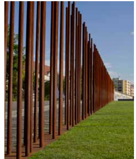
Markierung des ursprünglichen Mauerverlaufs in der Bernauer Straße