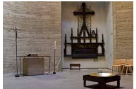
Kapelle der Versöhnung