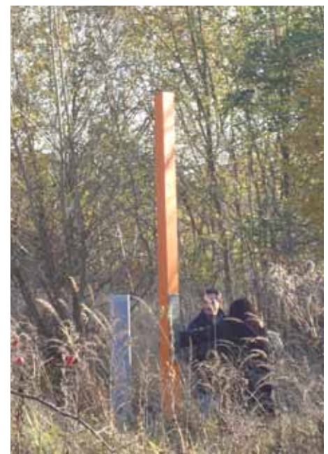
Spaziergänger informieren sich über den Tod von Eduard Wroblewski / Foto: Maria Nooke