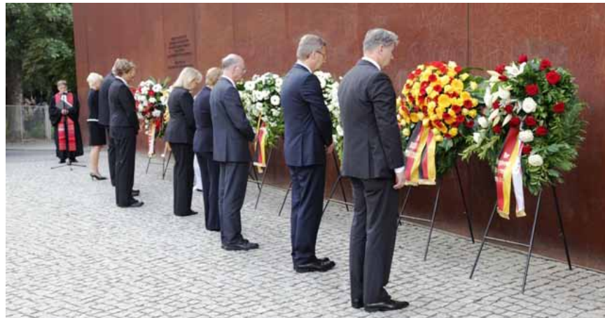
Gedenken an die Opfer von Mauer und Teilung