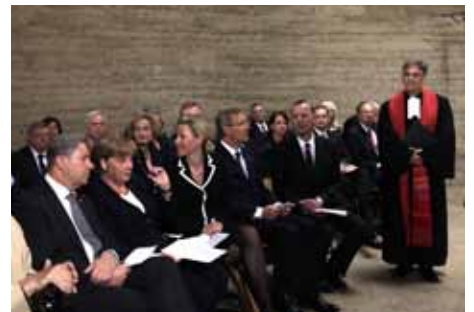
Andacht in der Kapelle der Versöhnung am 13. August 2011

stätte Berliner Mauer nie wirklich fertig sein. So wie die denkmalgeschützten Spuren ständiger Pflege bedürfen, braucht auch unsere Bildungs- und Zeitzeugenarbeit ständig neue Ideen, um auf eine sich dramatisch verändernde gesellschaftliche Umwelt angemessen zu reagieren. Sonst verödet die Gedenkstätte zu einem Ort des Rückblicks und verfällt. Unsere Gedenkstätte ist vor allem ein kultureller Ort, welcher im lebendigen Austausch mit den Formen und Stilen der Gegenwartskultur stehen muss. Da aber die Anlage das ganze Jahr, Tag und Nacht und mitten in der Stadt frei zugänglich ist, hat dieser lebendige Austausch eine Eigendynamik. Die angestellten Mitarbeiter und bürgerschaftlich engagierten Mitglieder des Fördervereins können sich deshalb nie auf dem erreichten Niveau ausruhen. Ich bin gewiss, dass sich die Gedenkstätte über kurz oder lang als würdiger Ort des Weltkulturerbes erweisen wird.