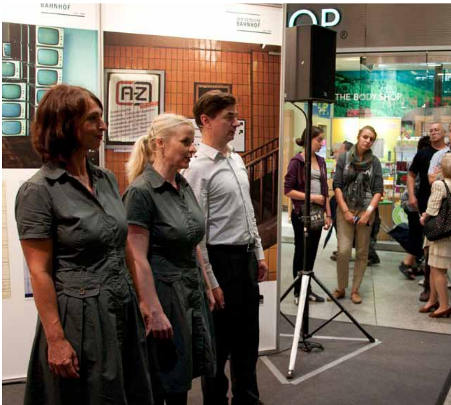
Theaterszenen „Mit der S-Bahn in den Westen“ im Bahnhof Friedrichstraße